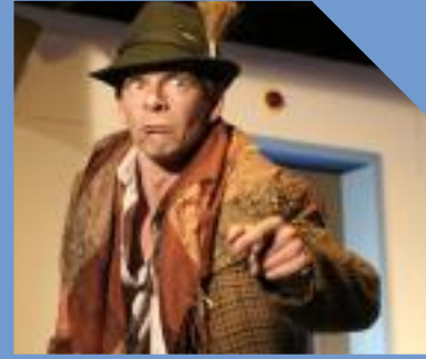
dolce vita Lauenförde