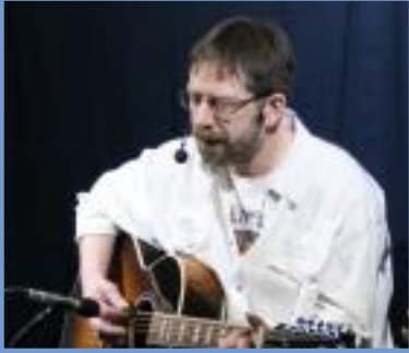
Totti Konzert Lüerdissen