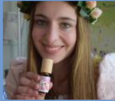
Märchen & Düfte Holzminden