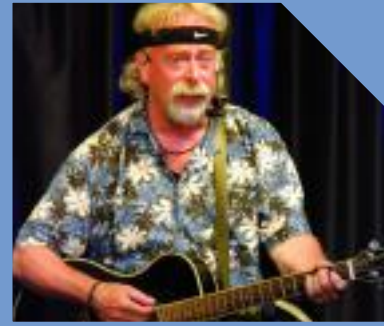
dolce vita Lauenförde