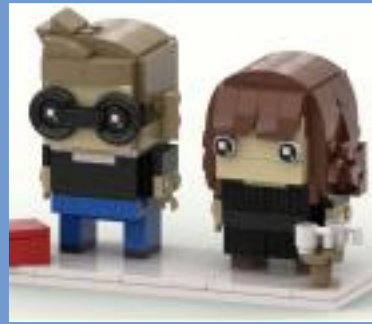
Grünes Labor Hameln