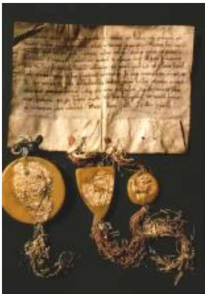
Erwerb der Grafschaft 1281