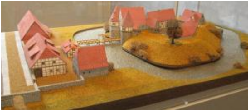
Modell der Burg nach dem Merianstich 1654