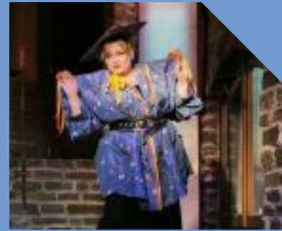
dolce vita Lauenförde