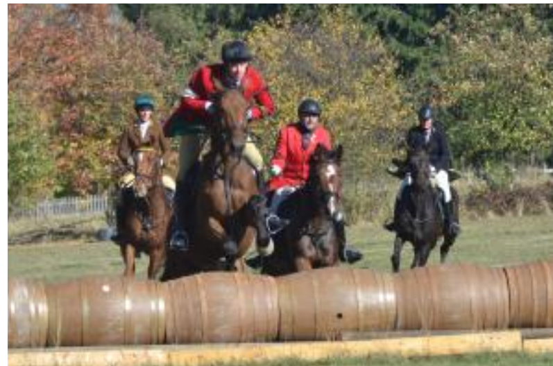
Hubertus Reitjagd in Neuhaus