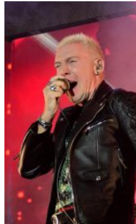
Roger Hodgson und Scooter in Beverungen