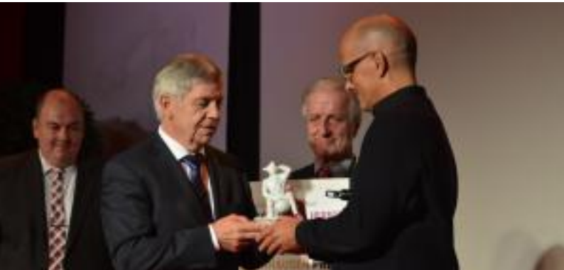
Münchhausenpreis 2018 - Gewinner: Christoph Maria Herbst