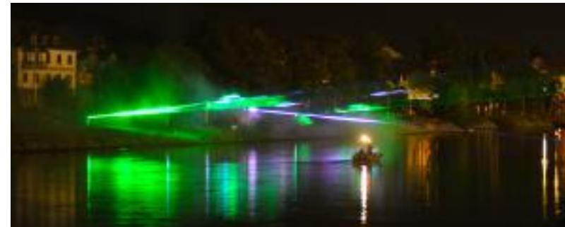
Lichterfest Bodenwerder 2018