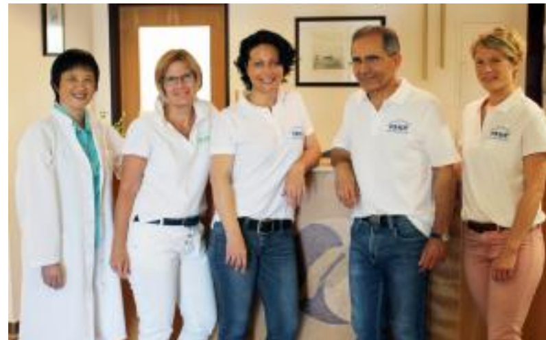
Das Team des APM-Gesundheitszentrums berät Sie gern.