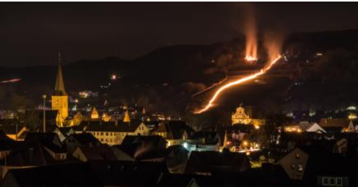
(Text & Fotos: Dechenverein Lügde, Dieter Stumpe)

seit Jahrhunderten wird hier jeweils am Ostersonntag der ursprünglich heidnische, heute christliche Brauch des Osterräderlaufes gelebt, für